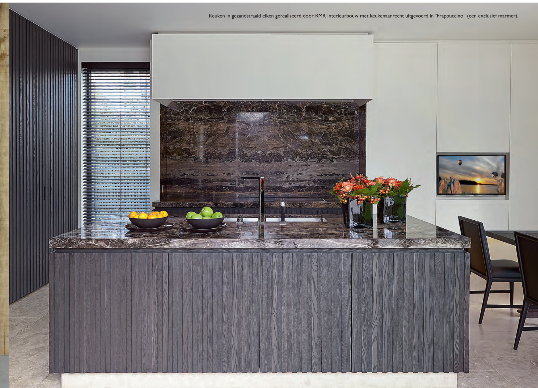
Keuken in gezandstraald eiken gerealiseerd door RMR Interieurbouw met keukenaanrecht uitgevoerd in “Frappuccino” (een exclusief marmer).